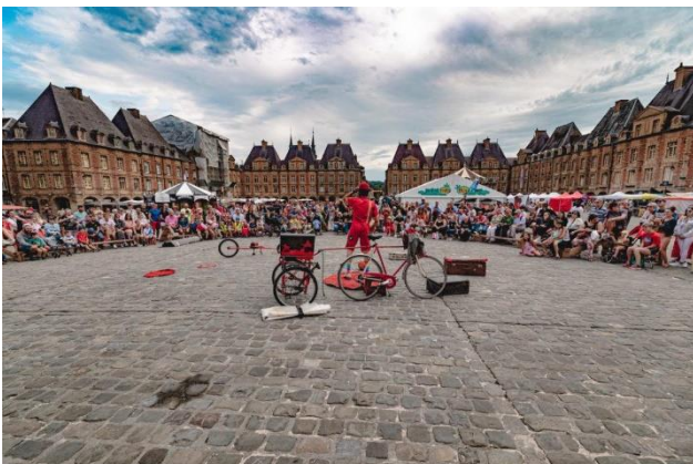
Place Ducale

Charleville-Mézières est la cité des arts de la marionnette, avec son Institut international, lieu d'enseignement, d'expérimentation et de réflexion, et surtout cet incontournable festival créé il y a soixante ans par Jacques Félix . Les Carolomacériennes et Carolomacériens sont très attachés à cet événement et nombre d'entre eux viennent grossir les rangs de la belle armée de bénévoles et garantissant ainsi la bonne marche de la manifestation. Toute la ville vit au rythme du festival. Restaurants, cafés, boutiques ont dans leur salle ou en vitrine des représentations de marionnettes où d'objets. On y entend parler des spectacles. Le bouche-à-oreille turbine. La Place Ducale a des airs de fêtes