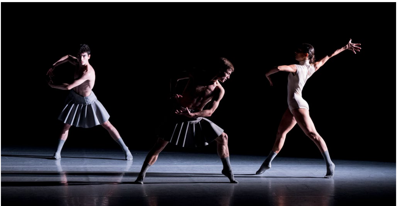
© Jordi Vidal, Twenty Eight Thousand Waves

Les spectacles sont toujours conçus avec une extrême exigence et de la plus grande qualité artistique ; ils sont défendus avec talent, fougue et impertinence par tous ces jeunes interprètes.